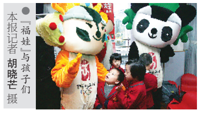
● “福娃”与孩子们