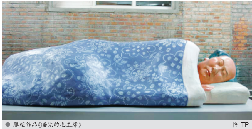
● 雕塑作品《睡觉的毛主席》 图 TP

56 岁的王文海是陕西省延安革命纪念馆退休职工，爱好雕塑。毛泽东逝世后，他用延安的泥土塑造了 1000 尊毛主席塑像，便有了“延安泥塑王”的称号。据王文海在庭上讲述：2002 年，他经一位艺术家介绍认识了中央美术学院教授隋建国。隋提出要和他合作一尊毛主席雕像。他们讨论后决定做一尊毛主席盖着被子的睡像。王文海单独完成塑像后，隋建国负责雕像的外表上色。隋与王文海约定双方共同拥有该作品的版权和著作权。2003 年 9 月，雕塑作品《睡觉的毛主席》第一次在