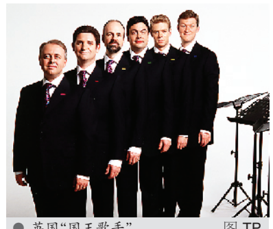
● 英国“国王歌手” 图 TP

本月 27 日，被称为“人声交响乐”的英国“国王歌手”无伴奏合唱团，将在上海音乐厅登台。那么，这是一支什么样的乐团？他们的表演有何特色呢？